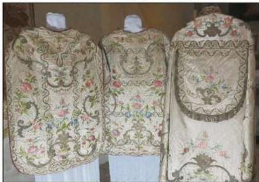
EXPOSITION. Un ensemble composé d'une dalmatique, d'une chasuble et d'une chape d'origine italienne, daté des années 1750.

La traditionnelle exposition de vêtements et d'objets liturgiques, organisée par Les Amis de l'église, sera ouverte au public, pour la première fois, ce dimanche.