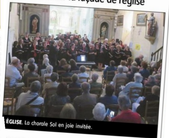
ÉGLISE. La chorale Sol en Joie invitée.