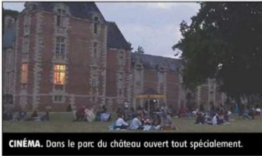
CINÉMA. Dans le parc du château ouvert tout spécialement.

La dernière projection de cinéma en plein air, dans le cadre de la cinquième édition du festival La Septaine, a été un succès. Un magnifique offert. L'ambiance était évidemment particulière. On pouvait chuchoter avec son voisin sans être entendu. Idéal pour tout