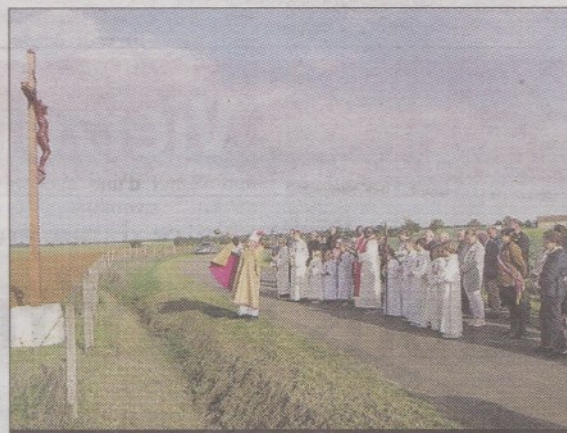
BÉNÉDITION. Par monseigneur Jérôme Beau qui a ensuite célébré la messe en l'église Saint-André.

Cette bénédiction était précédée d'une procession ouverte par une dizaine d'enfants de chœur et encadrée par la gendarmerie de Dun-sur-Auron, pour des raisons de sécurité.