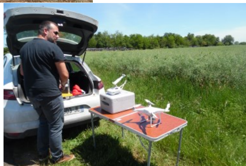
Optimisation de la hauteur de l'antenne à l'aide d'un drone

Les travaux se sont étalés sur plusieurs mois. Aux résultats, les débits ont été très significativement améliorés. Il reste ponctuellement trois zones non couvertes dont le moulin du Ravois, situé dans une cuvette.