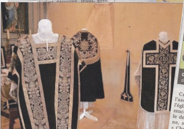
JUSSY-CHAMPAGNE. Les amis de l'église Saint-André organisent durant l'été, comme chaque année depuis 2015, une exposition, unique en Berry, de vêtements et d'objets liturgiques, dont certains sont inscrits à l'inventaire supplémentaire des monuments historiques. Aujourd'hui, de 14 heures à 18 heures, visite commentée de l'exposition et de l'église. Gratuit.

tête, depuis le 1 er septembre 2015, de l'inter-paroisses du Saint-Amandois. Il a été curé de la cathédrale de Bourges et des paroisses Saint-Étienne, Sacré-Cœur et Sainte-Barbe, 03.53.27.56, anadoo.fr, association : l'église Saint-André.