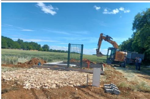
Réalisation de la plate forme

Fin décembre 2022, le pylône est opérationnel.