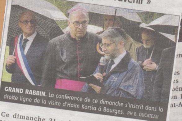
GRAND RABBIN. La conférence de ce dimanche s'inscrit dans la droite ligne de la visite d'Haim Korsia à Bourges.

Ce dimanche 21 août, l'association des Amis de l'église propose une conférence à 17 heures, à la salle des fêtes de la commune, sur le thème suivant « Chrétiens et juifs : en-