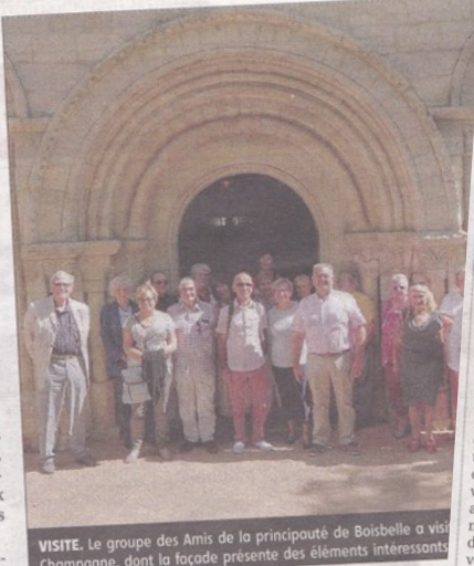
VISITE. Le groupe des Amis de la principauté de Boisbelle a visité Jussy-Champagne, dont la façade présente des éléments intéressants

Chasubles et chapes méticuleusement brodées de soie, d'or et d'argent sont étonnamment conservées dans un spectaculaire