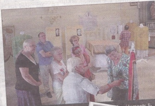
EXPOSITION. Lors de la visite de tableaux liturgiques, dans l'église.