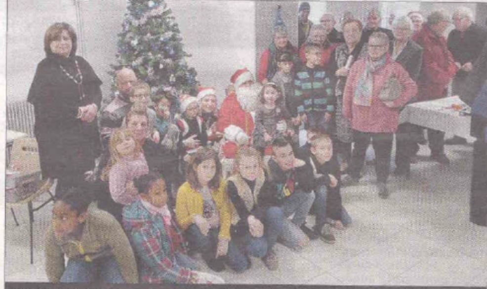
JUSSY-CHAMPAGNE. Dimanche, petits et aînés (une cinquantaine de personnes) ont été invités par la municipalité au clos Saint-André où ils ont vu Grand-père la lune , donné par la compagnie Enfant'images . Le père Noël a distribué des cadeaux. Les aînés ont reçu un colis.