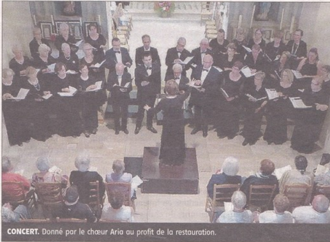
CONCERT. Donné par le chœur Aria au profit de la restauration.

L'édifice est classé monument historique. La première étape de cette restauration est la réalisation d'une étude diagnos-