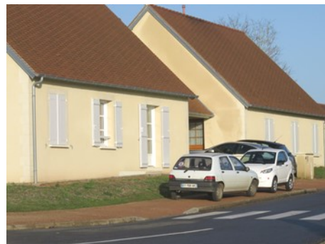
Volets des logements communaux