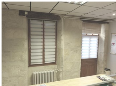
Restauration en pierres apparentes et peintures du secrétariat et du bureau du conseil / bureau du maire