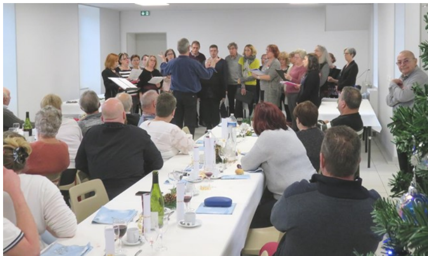
Repas des aînés et Septaine en Choeur

Le repas a été préparé pour la 4 e année consécutive par le traiteur « Aux Saveurs Gourmandes » de Saint-Germain du-Puy.