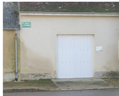
Volets de la bibliothèque