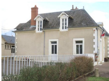
Huisseries de l'école

En 2018, notre agent communal a entrepris plusieurs chantiers de peinture et de rénovation, de quoi redonner de l'éclat aux bâtiments communaux.